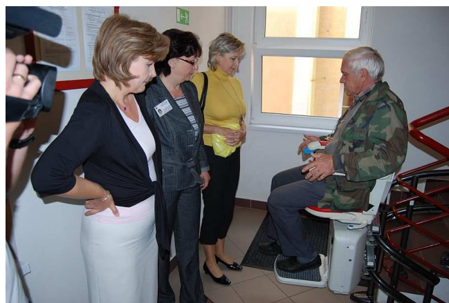
Inštalácia schodiskovej sedačky v budove Úradu práce, sociálnych vecí a rodiny na Ulici 17. novembra