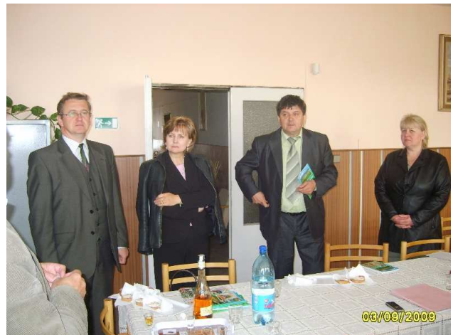
Kontrola cestných stavieb v okrese Stará Ľubovňa