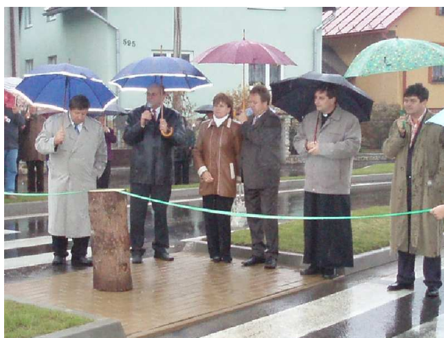
Otvorenie kruhového objazdu v Novej Ľubovni