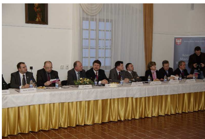
Stretnutie „maršalkov“ na hrade v Starej Ľubovni