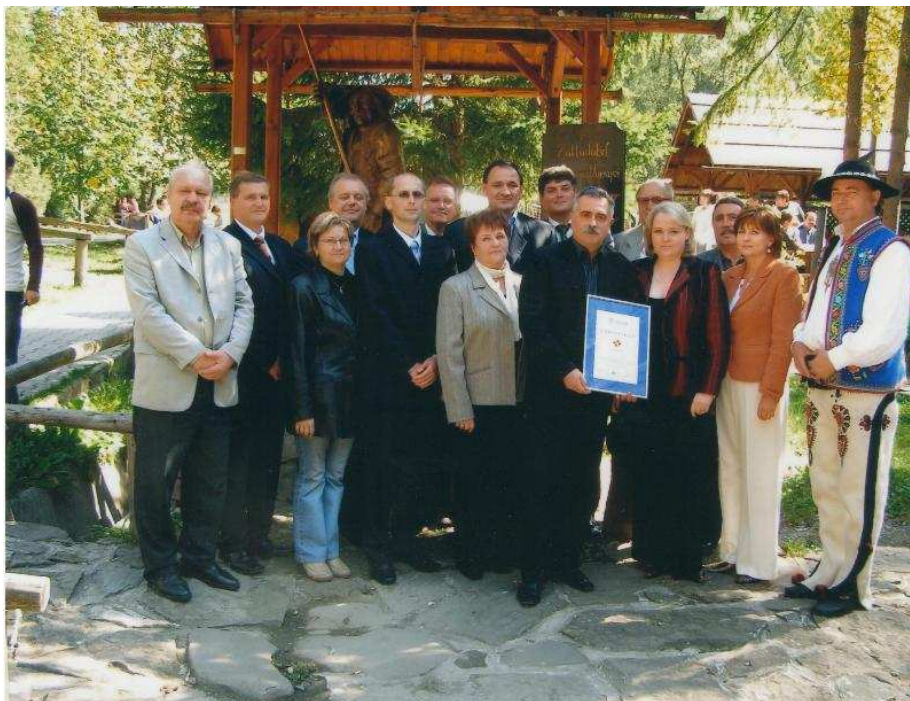
Odozdávanie certifikátu kvality

Podieľala som sa na procese získania certifikátu kvality STN EN ISO 9001:2000.