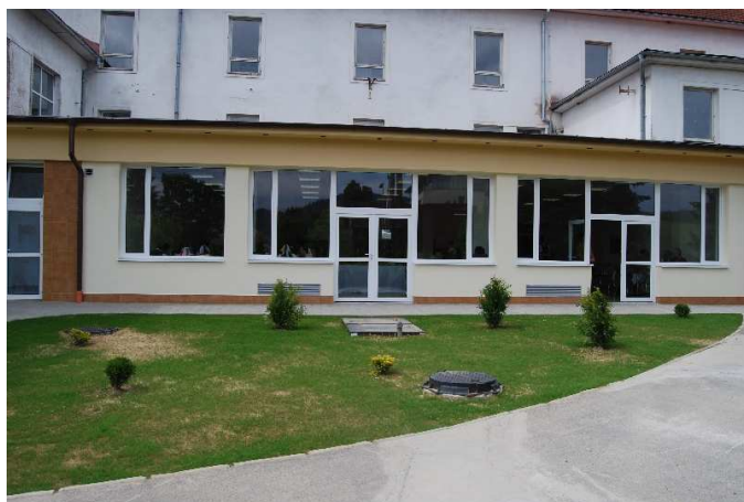
Otvorenie jedálne – Gymnázium Terézie Vansovej