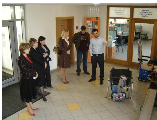
Výstava kompenzačných pomôcok