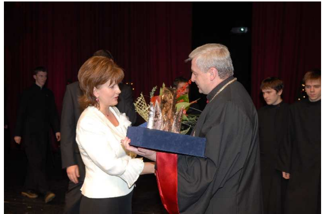
Ocenení pri preberaní cien PSK