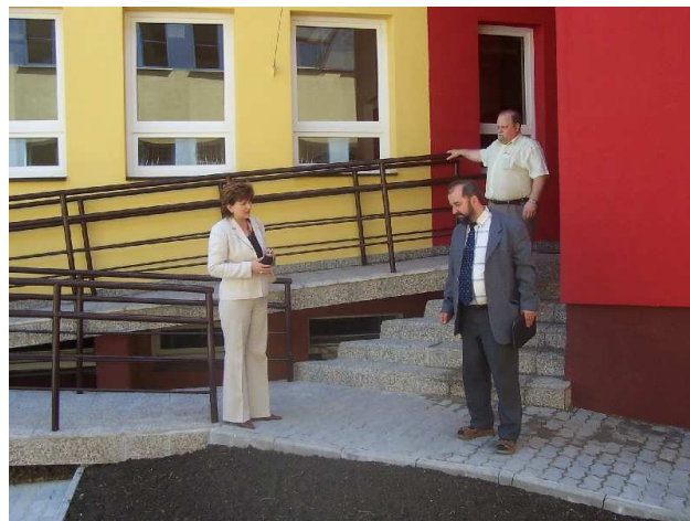
Kolaudácia budovy Úradu práce, sociálnych vecí a rodiny na Ulici 17. novembra